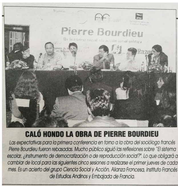
Imagen 3. Primera sesión reflejada en La Razón

La segunda conferencia, a cargo de Raquel Gutiérrez, fue el 10 de junio, dedicada a La dominación masculina, con el título “¿Hacia una igualdad entre hombres y mujeres o nuevas formas de dominación entre los géneros?”. El tema del género fue importante en el gobierno de Sánchez de Lozada; de hecho, en 1995 se creó la primera Subsecretaría de Asuntos de Género y se abrió el debate sobre la inclusión y el rol de la mujer en la sociedad y el Estado. El domingo previo se publicó en “Ventana” la traducción inédita en castellano de la entrevista de Isabelle Rüf a Bourdieu