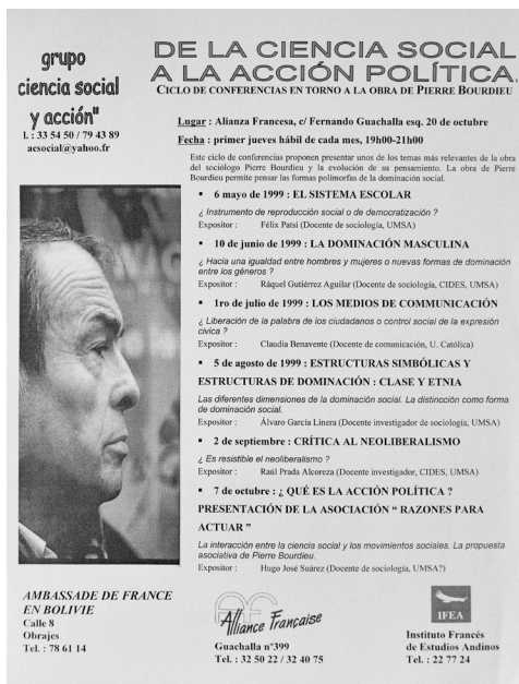
Imagen 2. Programa ciclo de conferencias

El 1 de marzo de 1999 le envié una carta a Bourdieu comentándole los planes y dos meses después contándole los detalles de la puesta en práctica.